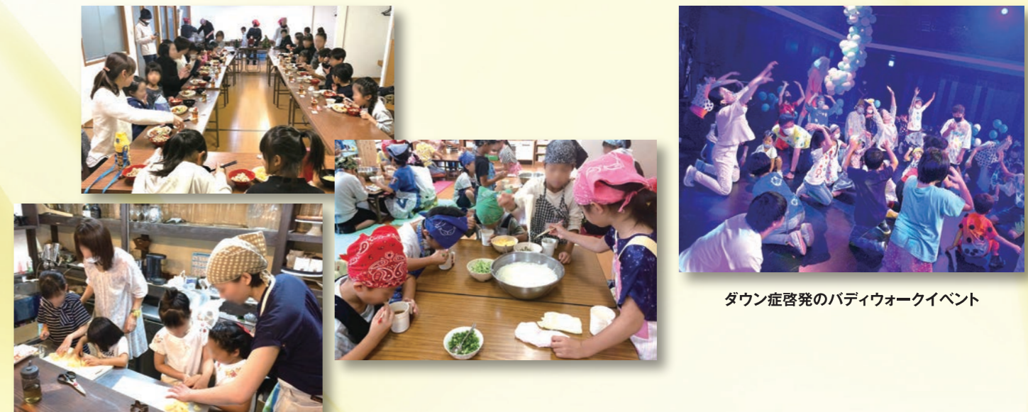
子ども食堂への助成