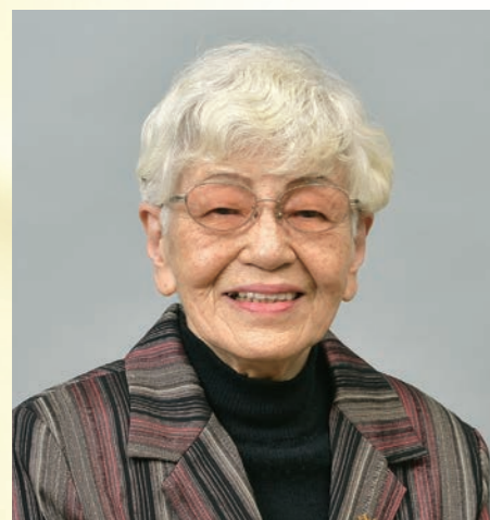
高齢社会をよくする女性の会・京都 前代表 認定特定非営利活動法人ウィメンズ・アクション ネットワーク(WAN) 元理事長