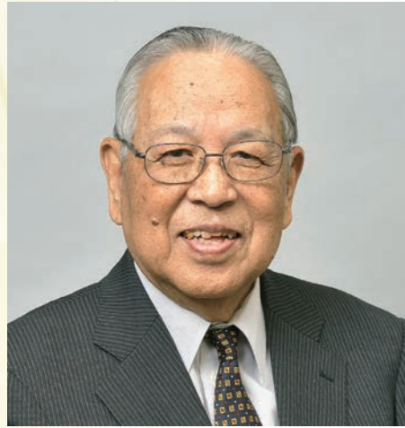
同志社大学名誉教授 一般社団法人京都ボランティア協会 名誉会長(前理事長)