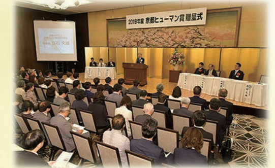
京都ヒューマン賞贈呈式

外部有識者による当基金の選考委員会において選考審査を行い、理事会において最終決定します。