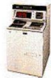
携帯撮即プリント