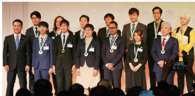
各エリアから選ばれたTOGAテーマの代表者

ロンロシアはこの問題を解決するために政府を巻き込み、トレーサビリティシステムを構築しました。このシステムは、製品につけたバーコードなどの情報を読み取り、その製品の原材料の調達から生産、そして消費や廃棄までを追跡可能な状態にするもので、ロシア国内では前例のない取り組みでした。これにより、消費者は合法的製品を選別し購入できるようになり、人々の健康が守られました。また闇市も小さくなり、政府の税収も増え、メーカーのブランド価値も高まりました。オムロンロシアは今後さまざまな食品や飲料にこのトレーサビリティシステムを展開し、よりよい社会を実現したいと意欲を燃やしています。