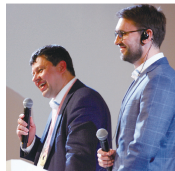
発表するオムロンロシアの代表者

ロンロシアはこの問題を解決するために政府を巻き込み、トレーサビリティシステムを構築しました。このシステムは、製品につけたバーコードなどの情報を読み取り、その製品の原材料の調達から生産、そして消費や廃棄までを追跡可能な状態にするもので、ロシア国内では前例のない取り組みでした。これにより、消費者は合法的製品を選別し購入できるようになり、人々の健康が守られました。また闇市も小さくなり、政府の税収も増え、メーカーのブランド価値も高まりました。オムロンロシアは今後さまざまな食品や飲料にこのトレーサビリティシステムを展開し、よりよい社会を実現したいと意欲を燃やしています。