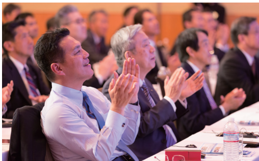
発表を聞く経営陣

ロシアでは市場に流通するアルコールの30%が偽造品で、毎年約6万人が急性アルコール中毒で死亡しており、偽造アルコールの流通が大きな社会問題となっています。オム